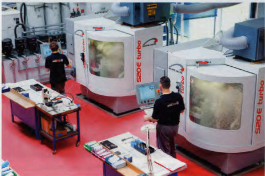
Bild 3: Inovatools, 1990 durch Georg Eckerle und Ditmar Ertel gegründet, gehört heute zu den Top-20 der Werkzeughersteller in Deutschland

schäftsbereichen. Der Umsatz von Indutrade belief sich im Jahr 2016 auf rund 13 Milliarden Schwedische Kronen (rund 1,3 Milliarden Euro).